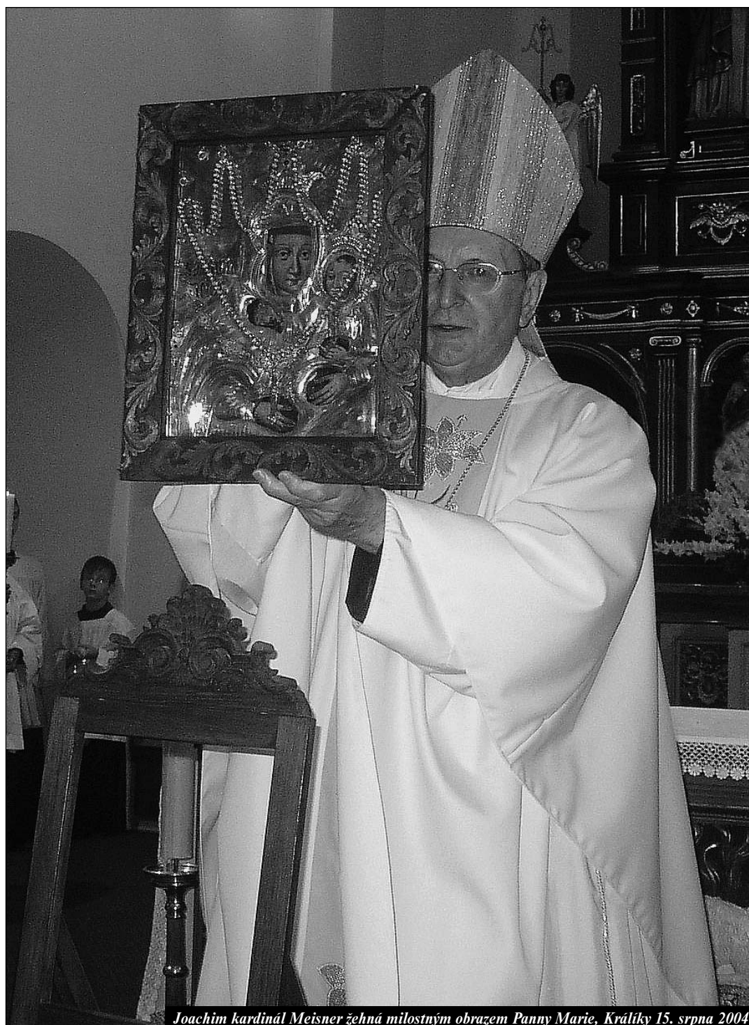
Joachim kardinál Meisner žehná milostným obrazem Panny Marie, Králíky 15. srpna 2004

Doba velkých útoků na dobré kněze - strana 13 -