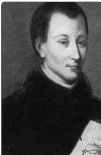
Blahoslavený Claude La Colombière

Markéta Marie uskutečnila ve svém životě v nejvyšší míře