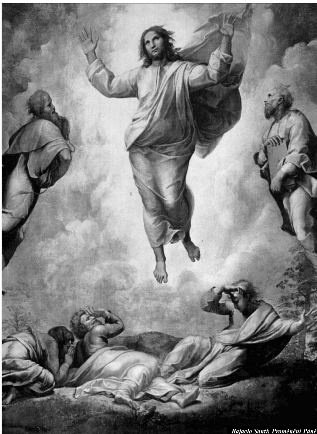
Rafaelo Santi: Proměnění Páně