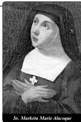
Sv. Markéta Marie Alacoque