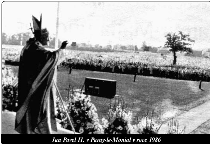
Jan Pavel II. v Paray-le-Monial v roce 1986

Církvi, která byla v té době ještě silně poznamenána galikanismem a projevovala krajní zdrženlivost, bylo možno vyslovit důtku, kterou Ježíš učinil dvěma učedníkům cestou do Emauz: „ Jak jste váhaví uvěřit všemu tomu, co řekli proroci! “ Musely to být naléhavé prosby polských králů Stanislava a Augusta III. (jeho vnukem byl později Ludvík XVI.) a 150 prelátů a opatů, kteří čekali na to, až papež Klement II. konečně schválí r. 1765 mešní formulář a oficiem k Nejsvětějšímu Srdci. Ve stejném roce byl francouzský klérus působením královny Marie Leszczyňské (Polky, manželky krále Ludvíka XV.) ochoten zavést ve všech francouzských diecézích svátek Božského Srdce, což se neobešlo bez těžkostí, protože v Rakousku se osvícenský císař Josef II. postavil proti a úctu ve své říši zakázal. Církev však už na své cestě pokračovala: 1899 zasvětil papež Lev XIII. lidstvo Nejsvětějšímu Srdci Ježíšovu; Benedikt XV. svatořečil Marii Markétu 13. května 1920; Pius XI. rozšířil svátek Božského Srdce na celou Církev; Pius XII. vyhlásil znovu poselství z Paray ve své slavné encyklice Haurietis aquas a Pavel VI. o ní hovoří v jednom ze svých apoštolských listů.