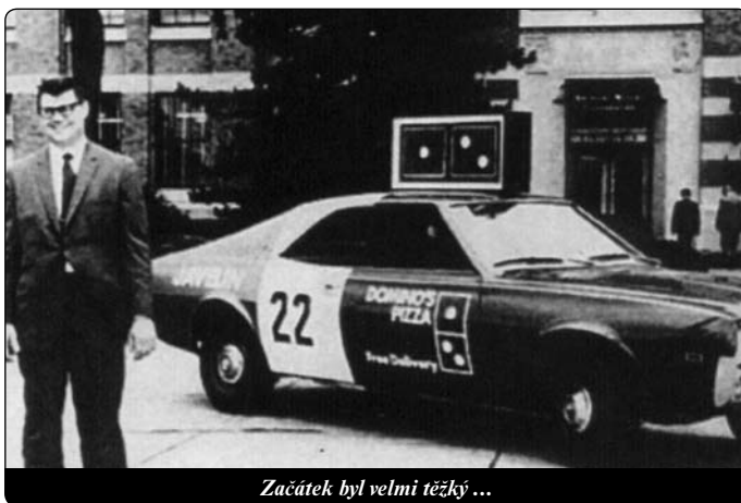
Začátek byl velmi těžký ...

V současné době se na mnoha katolických univerzitách silně zanedbává duchovní stránka a péče o prohlubování katolické víry studujících. V důsledku tohoto zanedbávání mají studenti po absolvování mnohem slabší víru než na začátku studia. Již 25 let jsem pociťoval potřebu založit katolická vzdělávací centra, která by se vyznačovala křesťanskou duchovností a péčí o prohlubování víry, aby vznikala elita silných vedoucích osobností v katolické církvi. Proto jsem určil 200 mil. dolarů na budovu nové univerzity a všechnu svou energii jsem soustředil na realizaci tohoto projektu, který bude pravděpodobně dokončen v roce 2006. Na univerzitě „Ave Maria“ se bude přednášet solidní katolická teologie, zcela věrná učení Církve. Všichni naši studenti budou muset v každém semestru absolvovat přednášky z teologie a filozofie. Byli vybráni nejlepší učitelé, kteří se zavázali, že složí přísahu věrnosti magisteriu do rukou místního biskupa. Na pozemku univerzitního městečka bude mnoho symbolů svědčících o tom, že