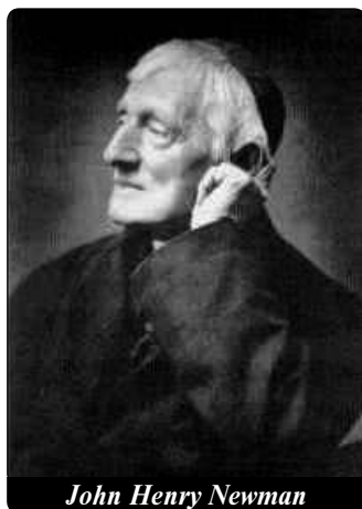
John Henry Newman

Autorita Církve a papeže má své hranice. Nemá nic společného se zvláštními nebo světskými modely vlády, jak tvrdili Newmanovi protihráči. Neomylná autorita Církve sahá tak daleko, jak sahá Zjevení. Když učiní papež rozhodnutí ve věci církevního pořádku, kázně nebo správy, nenárokují si taková rozhodnutí punc neomylnosti (např. jmeno-