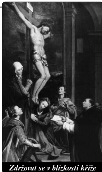
Zdržovat se v blízkosti kříže

Podobenství o bohatém pěstiteli obilí, které Spaemann cituje, stojí za to, abychom je znovu a znovu pročítali a promýšleli. Ježíš je vypráví v souvislosti se sporem o dědictví: Někdo ze zástupu ho požádal: „Mistře, řekni mému bratrovi, aby se se mnou rozdělil o dědictví!“ Odpověděl mu: „Človče, kdo mě ustanovil nad vámi soudcem nebo rozhodčím?“ Potom jim řekl: „Dejte si pozor a chraňte se před každou chamtivostí. Neboť i když má někdo nadbytek, jeho život není zajištěn tím, co má“ (Lk 12,13-15). Spory o dědictví jsou bolestným, ale stále aktuálním tématem. Ja-