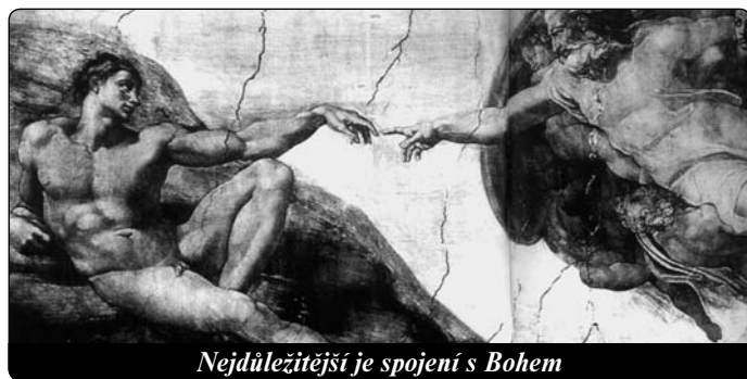
Nejdůležitější je spojení s Bohem

Tak jako má země svou oběžnou dráhu kolem slunce, tak má člověk kroužit kolem Boha, svého Středu. Zda je tomu tak, zda Bůh, náš Stvořitel a Otec, skuteč-