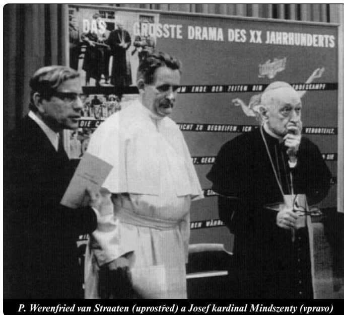
P. Werenfried van Straaten (uprostřed) a Josef kardinal Mindszenty (vpravo)

Duchovní impulsy jsou nutné nejen pro obranu křesťanské Evropy proti islámu. Jsou také nutné pro vnitřní restauraci. Zde bylo možno pozorovat zvláštní zápolení mezi nevěrci a věřícími. Začalo již dávno před vstupem, například zatímco Poláci se bránili liberalizaci potratových zákonů, některé země se snažily přimět je k tomu již před pěti lety. Bez „přizpůsobení evropskému standardu“, říkali minis-