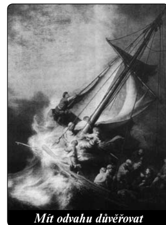
Mít odvahu důvěřovat

„Spíš než bohatší chtějí být chudší.“ – To je paradox. To odporuje všemu, co je běžné. Chtít mít stále víc a víc: to je deviza blahobytné společnosti. Evangelium však udává jiná měřítka hodnot: Blahoslavení chudí, neboť jejich je nebeské království – Ale běda vám, bohatí, už máte své potěšení (Lk 6,20.24). Jak těžko vejdu do Božího království ti, kteří mají bohatství. Spí-