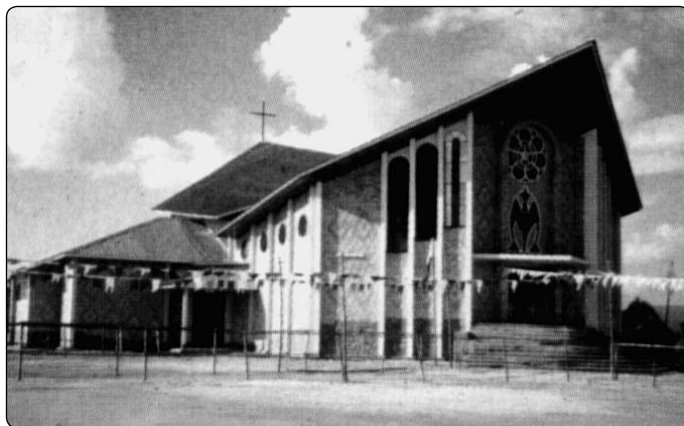
Kibeho: nový kostel zasvěcený Panně Marii Bolestné

Události v Kibeho přispěly k tomu, že nyní se v naší Církvi projevil nový zápal. Mnoho křesťanů, i mládeže a intelektuálů, se opět vrátilo k náboženské praxi, někteří vlažní se stali horlivými a smířili se s Bohem i s lidmi. Při této pouti jsme viděli mezi poutníky i poslance rwandského Národního shromáždění, státní sekretáře a me-