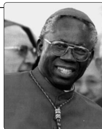
Kardinál Francis Arinze

Arinze: Svatý otec napsal to, co jste citoval, ale nevyvodil z toho důsledky, které uvádí druhá část vaší otázky. Papež chtěl prostě říci, že je nezbytné dodržovat věrně liturgické knihy, které byly vypracovány po 2. vatikánském koncilu. Proto je třeba nové liturgické knihy znát, studovat, usilovat o jejich pochopení a milovat je a konečně také praktikovat. Ale Jan Pavel II. ustanovil také komisi Ecclesia Dei , která je kompetentní analyzovat požadavky kněží a věřících, kteří chtějí slavit mši svatou v tzv. ritu Pia V. Slavit mši svatou podle starého Ordo missae není tedy za-