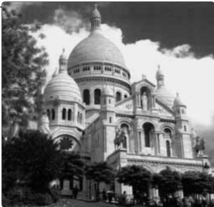
Chrám Božského Srdce na Montmartru

Tuto iniciativu potvrdil nakonec v roce 1873 i francouzský parlament. 25. července Národní shromáždění přijalo 382 hlasy proti 138 usnesení, že bude vybudována bazilika jako smírný zásvětný dar francouzského národa. Stavba započala v roce 1876 a byla dokončena až v roce 1914. Na průčelí baziliky stojí nápis: Christo eiusque Sacratissimo Cordi Galia Poenitens et Devota: Kristu a jeho Nejsvětějšímu Srdci Francie kající a zbožná.