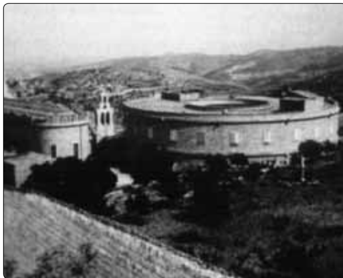
Karmelitánský klášter v Betlémě

na dvou různých místech. Nesla Kristovy rány, její předpovědi se plnily a měla mnoho vidění. Uchváčena Duchem Svatým skládala nádherné hymny a písně ve francouzštině, řeči, kterou v běžném životě mluvila jen zlomkovitě. Zvláště výrazná byla její poslušnost vůči představené. K tomu se váže jedna anekdota. Jednoho dne vzlétla ve vytržení na vrcholek jedné lípy. Představená jí poručila, aby v poslušnosti ihned sestoupila dolů. Jindy byl pro ni takový příkaz jediným prostředkem, jak ji vyvést z extáze. Tentokrát chtěla Miriam ještě chvilku zakoušet nadpřirozený zážitek. Spadla v tom okamžiku ze stromu.