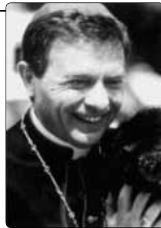
Mons. Tonino Bello

Vám všem chci říct: obraťte svůj pohled k Tomu, které-