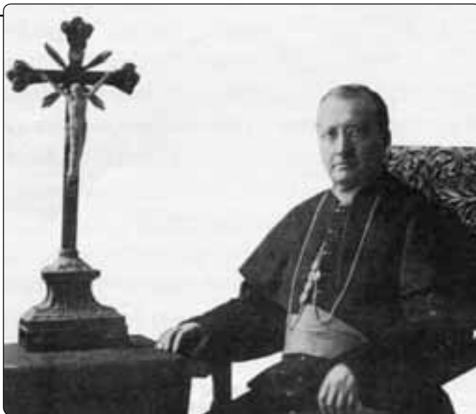
Guido Maria Conforti - parmský biskup

Jméno Conforti šlo mezitím v Římě od úst k ústům a došlo k rozhodnutí jmenovat ho v Emilii biskupem. R. 1902 ho Svatý stolec jmenoval arcibiskupem v Ravenně. Lev XIII. si ho chtěl podržet v Itálii. Myslel na nevěřící v „rude“ Emilii a řekl s nádechem ironie: „Dověděl jsem se, že byste chtěl vyrazit do Číny. Ravenna je italská Čína.“ Ale Conforti zůstal v Ravenně jen dva roky, protože nemoc ho odsoudila k nečinnosti a přiměla ho, aby podal Piu X. svou demisi. Je rok 1904. Conforti se