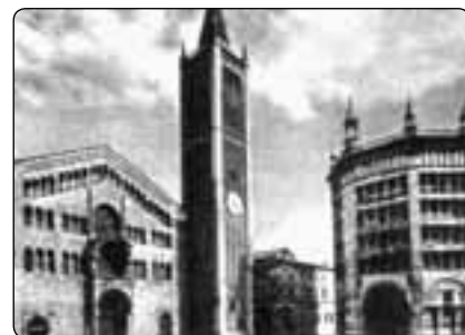
Katedrála v Parmě

Pro tyto apoštoly neváhal vzít na sebe jakoukoliv námahu, aby si vyprosil almužny