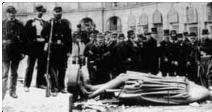
Komuna, vzniklá v r. 1871, začala tím nejsnazším – vandalismem, pokračovala znesvěcováním kostelů a vražděním kněží

26. dubna 1871 zaslal Pius IX. zvláštní breve předsedovi výboru pro výstavbu baziliky Leonu Cornudetovi a celý projekt schválil a poželal mu. Krátce nato začaly po celé Francii sbírky na stavbu svatyně.