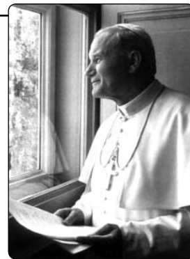
Jan Pavel II. v r. 1978

Do dnešního dne napsal Jan Pavel II. 14 encyklik a nespočet dalších apoštolských dokumentů. V každém z nich připomíná funkci Panny Marie v životě Církve i věřícího. Některé z těchto dokumentů představu-