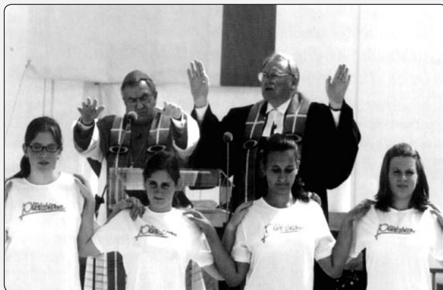
Ekumnické bohoslužby v Berlíně – iluze nás k jednotě nepřivedou