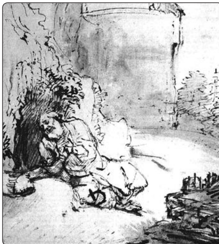
Rembrandt: Jonáš pod ninivskými hradbami, perokresba, Vídeň

ve bude vyvráceno (3,4) obsahuje symbolismus 40 dní, který poukazuje na izraelské putování pouští a dává tedy tématu pokání konkrétní podobu. Září zde jádro poselství Nového zákona z Ježíšových slov: Obrátte se a věřte evangeliu (Mk 1,15).