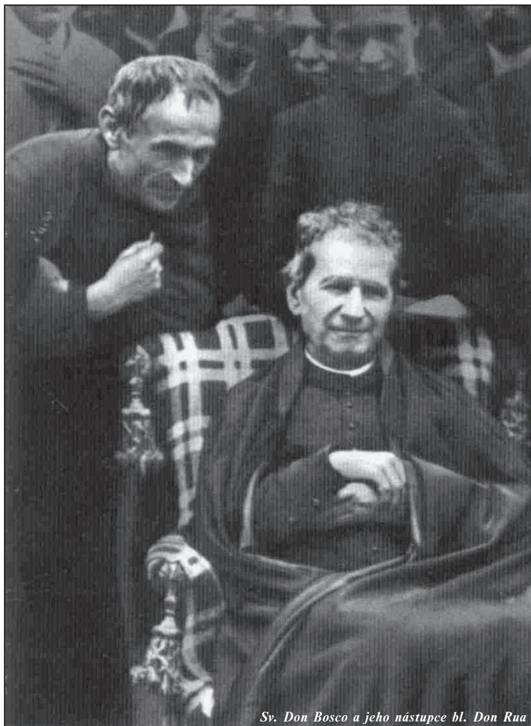
Sv. Don Bosco a jeho nástupce bl. Don Rua