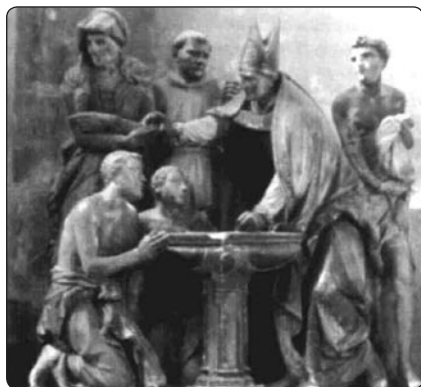
Sv. Ambrož křtí sv. Augustina

Šlechtickému synu z rodu Ambrosiánů nesmělo nic scházet, a to ani v Římě, kam se jeho matka se třemi dětmi po smrti svého manžela přestěhovala.