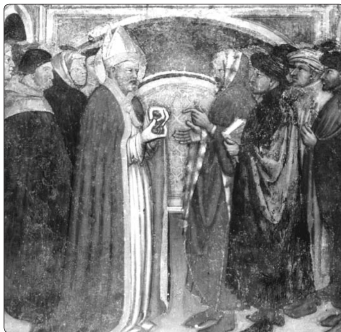
Sv. Ambrož a sv. Augustin

Nestanul mezi nimi jednou dokonce i Augustin? Kdyby Ambrož způsobil jen toto jediné obrácení horkokrevného Afričana, již tím by prokázal Církvi neocenitelnou službu. Tři císařové se ucházeli o přízeň tohoto biskupa. Císař Gratián přeložil na pět let své sídlo do Milána, aby nepostrádal bezprostřední radu biskupa Ambrože.