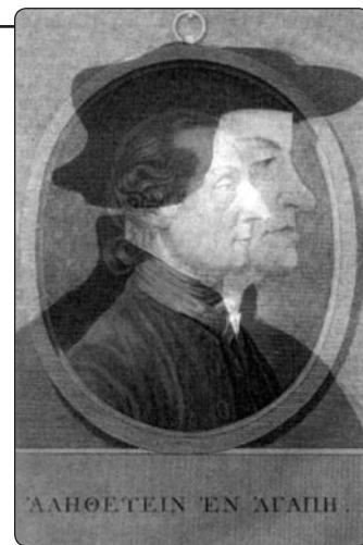
Johan Kaspar Lavater - převtělený Zwingli?

Reinkarnační představy začaly být opět aktuální koncem XVIII. století v esoterických kruzích . Karel hrabě Hessenský (1744–1836) byl příkladem přesvědčeného přívržence převtělování a současně svobodného zednáře: ve svobodném zednářství své doby hrál vedou-