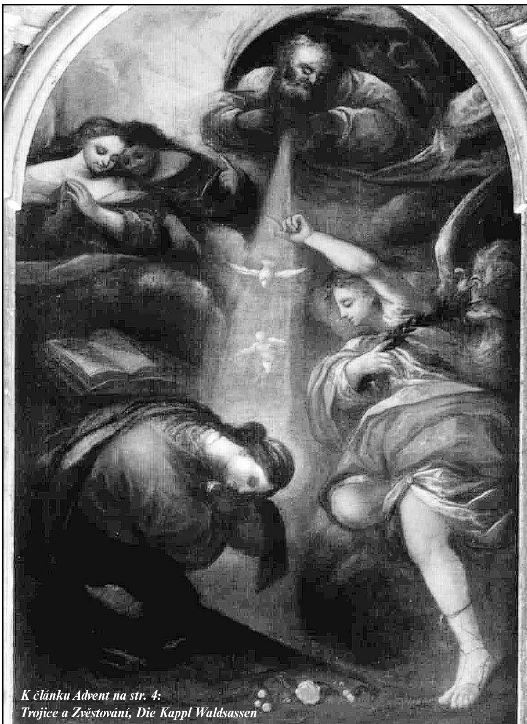
K článku Advent na str. 4: Trojice a Zvěstování, Die Kappl Waldsassen

Maria Pomocnice křesťanů, zakladatelka salesiánského díla - strana 14 -