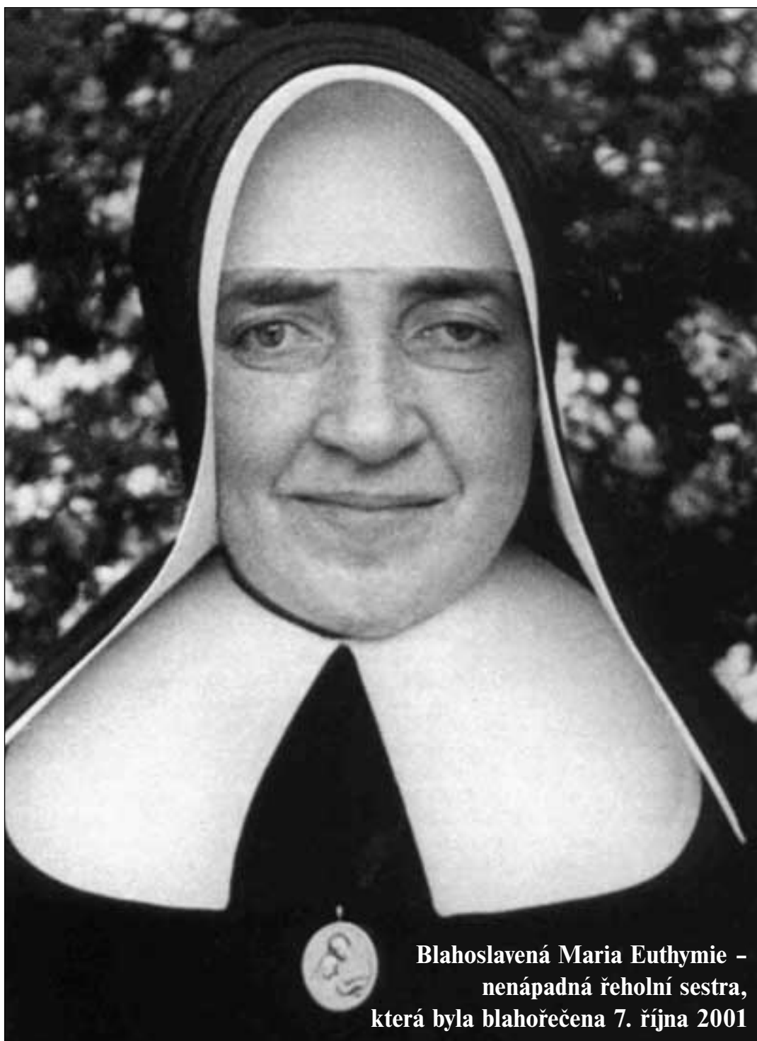
Blahoslavená Maria Euthymie – nenápadná řeholní sestra, která byla blahorečena 7. října 2001