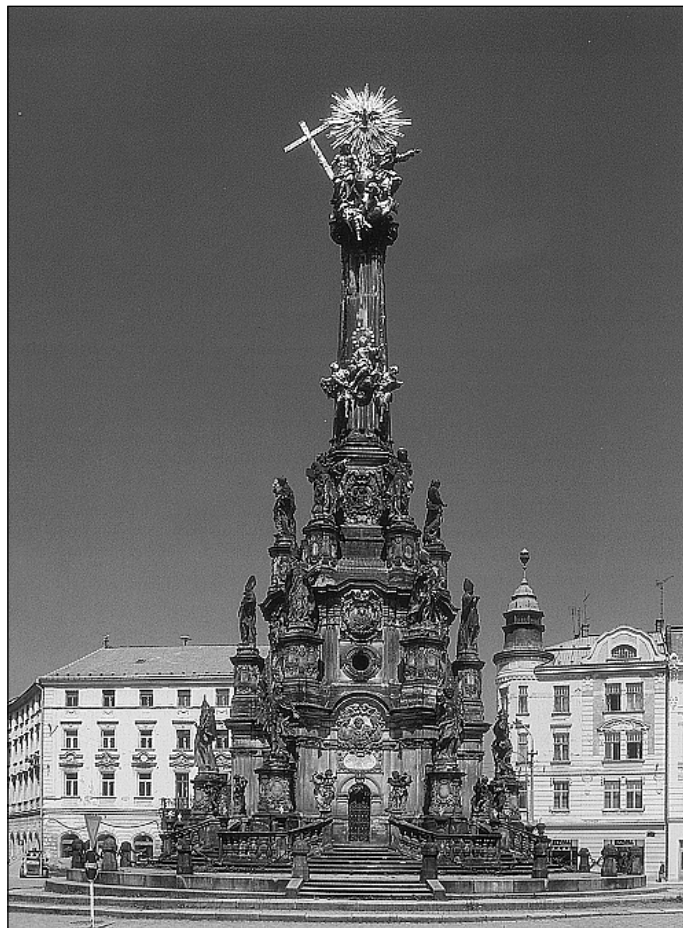
Barokní sloup s vnitřní kaplí vysoký 35 m byl zbudován v letech 1716-1754 po morové epidemii ke cti Nejsvětější Trojice. Nese reliéfy 12 apoštolů, sochy 18 světců, 3 ctností, nanebevzetí P. Marie, andělů se sv. Michaelem a silně zlacené vrcholové sousoší Nejsvětější Trojice.