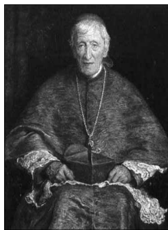
Kardinál John Henry Newman

Ve svém nejznámějším díle »Apologia pro vita sua« píše: »Jestliže se nemýlím, je hlavním důvodem, pro který pře-