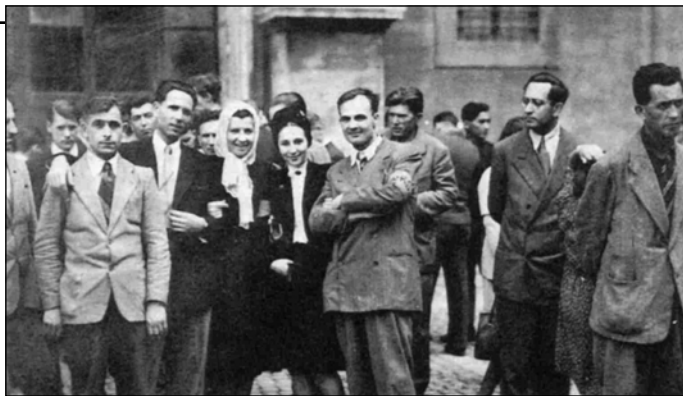
Skupina Židů čekajících na audienci u Pia XII., aby mu poděkovali za záchranu života během II. světové války

Měli především jasnou představu o dědičné vině a jejich důsledcích pro lidskou přirozenost. Toto vědomí je nevedlo k beznadějnému pesimistické-