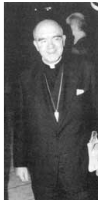
Kardinál A. L. Trujillo

Nedá se popřít, že velký počet lidí je zmatený a narušený, protože velké vymoženosti naší společnosti hrozí odbouráním duchovních základů. Jsou to základy, na kterých stojí naše lidství. Chybí rozvaha, hrneme se do budoucnosti. Tento dojem