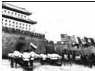
Vítězící anglické vojsko

Mezitím došlo k událostem, které se odrazily v životě křesťanů. V červnu 1840 dal císařský komisař z Guangdongu hodit do moře 20 000 beden s opiem. S touto drogou obchodovali Angličané. Jeho čin se stal záminkou k válce, kterou Angličané vyhráli. Čína byla přinucena podepsat v roce 1842 první mezinárodní dohodu moderního typu, po níž následovaly dohody s Amerikou a Francií. Francie využila příležitosti a vystoupila v roli ochránkyně misí. Byly vydány dva dekrety: jeden v roce