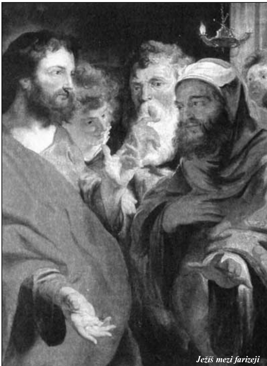
Ježíš mezi farizeji