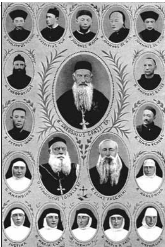
Mnoho misionářů i věřících laiků bylo zabito, mnoho kostelů zbořeno

Počátkem poslední dekády 16. století byli vysláni do Číny různí katoličtí misionáři: byli vybíráni s velkou pečlivostí, aby kromě ducha víry a lásky měli velký kulturní rozhled a byli odborníky v různých oblastech vědy, zvláště v astronomii a v matematice. Bylo to právě díky těmto znalostem, které misionáři osvědčili před vědychtivými Číňany, že mohli navázat trvalé vztahy prospěšné vědecké spolupráce zvláště na poli astronomie a při úpravách kalendáře, který byl pro Číňany politickým nástrojem vysoké hodnoty. Tyto vztahy pomohly otevřít mnohé brány, nakonec brány samotného císařského dvora, a tím vzbudit zájem různých významných osob.