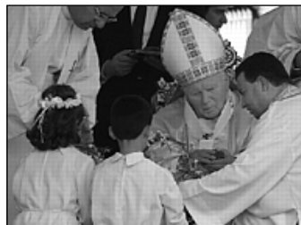
Mše svatá na stadionu v Damašku

Nyní na počátku třetího tisíciletí se Areopag v Athénách stal v jistém smyslu »areopagem světa«, odkud se křesťanské poselství spásy předkládá všem, kteří hledají Boha a jsou »bázlivi« při přijímání nevyčerpatelného tajemství pravdy a lásky. Zvláště skrze čtení společného prohlášení, které jsem na závěr bratr-