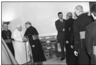
Setkání s katolickými biskupy

Večerní návštěva Svatého otce v mešitě Omayyadů je první tohoto druhu vůbec. Mešita je tak nazvána na počest kalifů, kteří dobyli Damašek v 7. století. Na tomto místě stála původně bazilika sv. Jana Křtitele, postavená ve 4. století na místě pohanského Jupiterova chrámu. Vedle baziliky stál klášter. V 7. století obsadili město muslimové. Vládcé Valid I. nabídl křesťanům, že jim vrátí chrám zasvěcený Panně Marii, když mu odstoupí celý terén baziliky sv. Jana, která již byla změněna na mešitu. Pak baziliku zbourali a postavili mešitu.