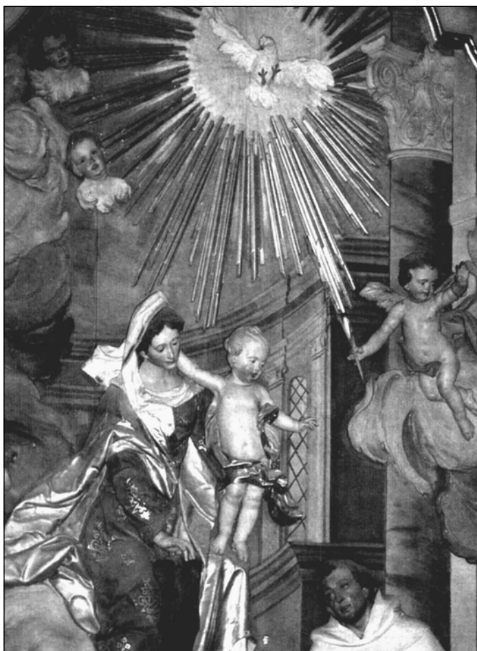
Škapulířový oltář v karmelitánském kláštře Reisach nad Innem