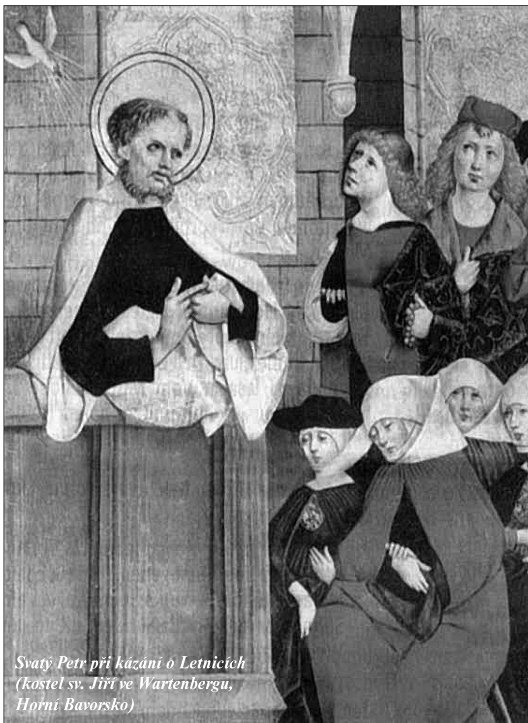
Svatý Petr při kázání o Letnicích (kostel sv. Jiří ve Wartenbergu, Horní Bavorsko)

Kristologické katecheze Jana Pavla II. - strana 13 -