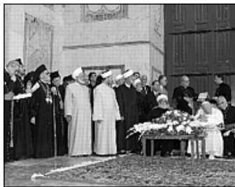
V mešitě Omayyadů

vštěvníci musí odložit obuv. Učinil tak i papež. Ve zvláštním sálu mu podali šálek hořké kávy. Chvilí rozmlouval s velkým muftím šejkem Ahmedem Kuftarou. Pak v bílých pantoflích vstoupil do vlastní mešity a delší dobu se modlil u ostatků Jana Křtitele. Slepý muezzin zazpíval fragmenty z Koránu. Ministr náboženství Ziada Vakf řekl ve svém projevu, že i když křesťané a muslimové vyznávají různá náboženství, jsou dětmi téhož Boha. »Nikdo si nesmí myslet, že je lepší, protože vyznává náboženství, které