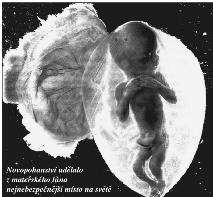
Novopohanství udělalo z mateřského lůna nejnebezpečnější místo na světě

Přes všechny Boží zázračné zásahy a přes mnohá varování a tresty propadají Izraelité stále znovu pohanské modloslužbě a oddávají se v opilosti nedůstojným orgiím Baalova a Astartina kultu. Dokonce sám Šalamoun pořídí pro Jeruzalém obrazy božstev. Za vlády krále Achaba zůstane v království Izrael odděleném od Judeje jen jediný člověk, který se klaní pravému Bohu, Pánu nebe a země: Eliáš. V Judském království naopak víru zachovali. V Kristově době jsou stále ještě bezvládné pohanské kmeny Samaritánů předmětem pohrdání u Židů. Samaritánka měla pět mužů a nyní žije s dalším (Jan 4,7-42). Klanění