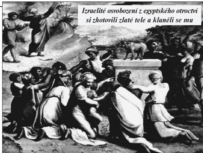
Izraelité osvobození z egyptského otroctví si zhotovili zlaté tele a klaněli se mu

je podle ní možné jen na jedné hoře. Ježíš se jí ujímá a sdělí jí, co ještě nikomu neřekl: že je Mesiáš. Nepřišel pouze proto, aby vykoupil židy, nýbrž aby osvobodil i pohanský svět od jeho bohoslužby.