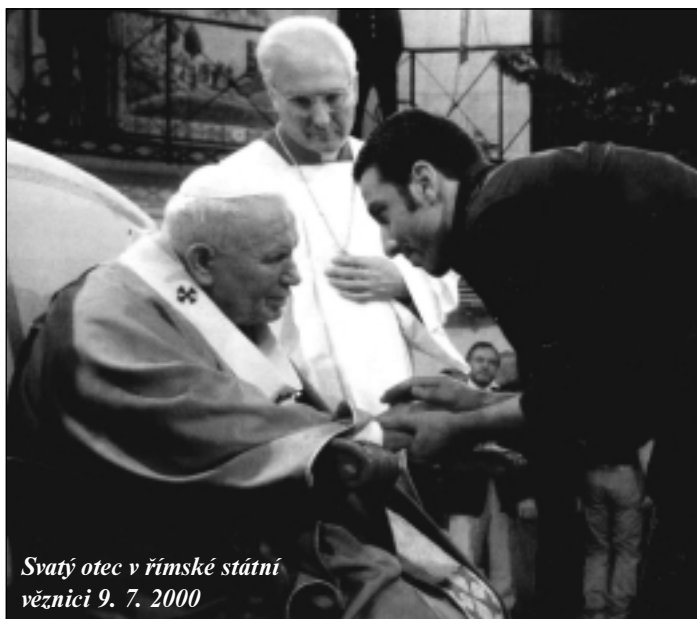
Svatý otec v římské státní věznici 9. 7. 2000