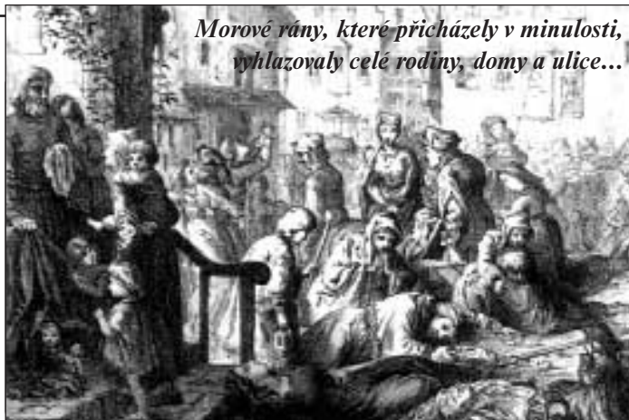
Morové rány, které přicházely v minulosti, vyhlazovaly celé rodiny, domy a ulice...

Mnoho současníků vidělo v morových ranách Boží trest. Jedni litovali svých vin, dělali pokání a bičovali se. Jiní se oddávali prostopášnému životu. Morová vlna vyhladila celé rodiny, domy a ulice, ochromila obchod, hospodářství a naplnila nouzové hřbitovy a masové hroby. Probudila však živější vědomí smrti. Vznikly umělecké cykly o tanci smrti, ve kterých dominuje smrt s kosou.