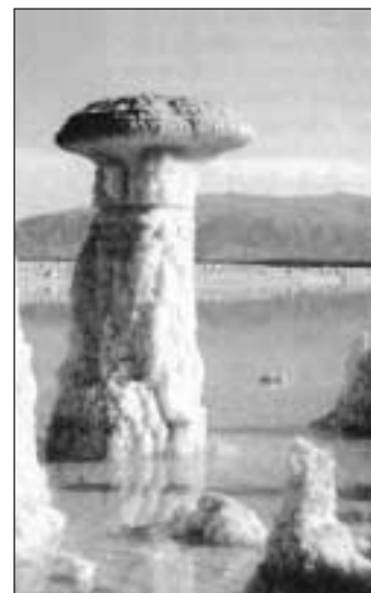
Solný sloup uprostřed moře

Vyjednávání Abraháma s Hospodinem o osud Sodomy (Gen 18,22) nelze chápat jako produkt obchodnického ducha, který se nezastaví ani před Božím tajemstvím, nýbrž je to výraz lidského prosebného úsilí, které jde až do krajních možností. Právě