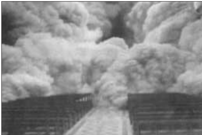
Horní bazilika sv. Františka v Assisi - 26. 9. 1997, 11 hod. 42 min.

Blahoslavená duše, která se dnem i nocí nezabývá jinou záležitostí než tím, jak jednoho velkého dne stane před Soudcem, kterého obklopí všechno stvoření, a bude se zodpovídat ze svého jednání, aby pak mohla klidně stát za svými řečmi i skutky. Kdo má onen den a hodinu před očima a stále myslí na svou obranu před neúprosným soudním stolcem, ten nebude hřešit buďto vůbec, nebo jen velmi málo. Neboť ke hříchu dochází z nedostatku bázně Boží. Ty, které oživuje živá obava z hrozby, těm vnitřní bážeň nedopřává času, aby upadli do nechtěného jednání nebo žádostivosti. Mysli proto na Boha,