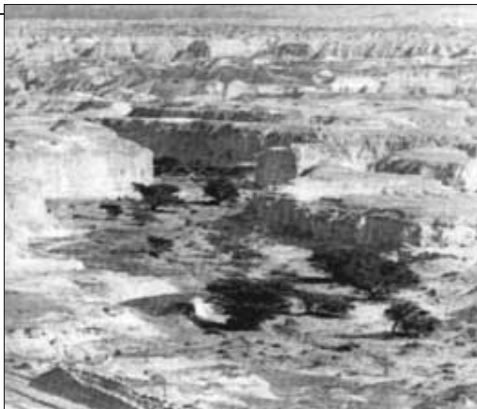
Tato krajina byla za dob Lotových jako Hospodinova zahrada (Gen 13,10). Při archeologických vykopávkách (1924-1973) byla objevena města Sodoma a Rung en Numera, někdejší Gomora.

Zánik těchto měst představuje pro věřícího Boží soud, nevě-