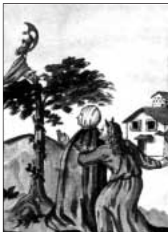
Mezi Kristem a ďáblem

i ti nejzavřelejší, jak rád bych k nim byl milosrdný, abych je zachránil. Ty jsi vůdce pro hříšníky, aby ke mně přišli skrze tvůj příklad. Moje dcero, postavil jsem tě jako světlo uprostřed temnoty, jako novou hvězdu, kterou dávám světu, abych slepým přinesl světlo, zbloudilé přivedl zpět a abych napřímil ty, kteří se hroučí pod tíží vin. Ty jsi cesta zoufalých, hlas milosrdenství.»