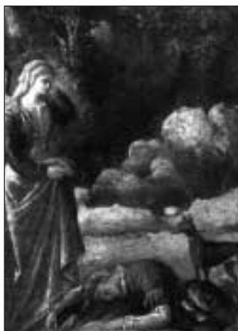
U mrtvoly milence

za šaty. V strašné předtuše následuje zvíře, až konečně najde v blízkém lese mrtvolu zabitého milence. Pohled na tělo pokryté ranami, zohavené a zčásti již v rozkladu ji rani až do morku