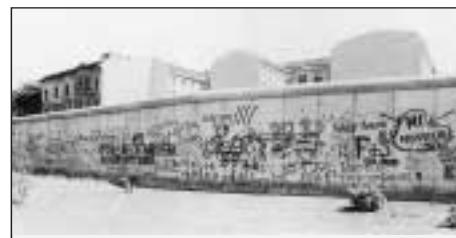
Nevkusnými obrazy zohavené domy, nároží a dopravní prostředky jsou jakoby veřejnou ilustrací skutečnosti, že v naší společnosti padla všechna tabu...

V této době liberalizovaného tržního hospodářství se pojednou cítíme téměř všude nějak ohroženi, protože už kolem sebe takřka nenacházíme, na co bychom se mohli opravdu spolehnout, ať už je to banka,