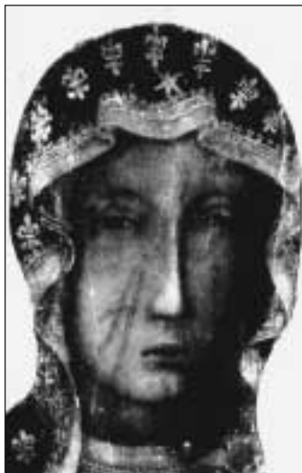
Tvář P. Marie Čenstochovské

lidi, kteří zdánlivě vyznávají hinduismus a současně poukazují na evangelium, ve skutečnosti však jej zavádějí do světa okultních a ezoterických praktik. Orientální techniky v něm rozvinou silné schopnosti média a je vyzván, aby je začal využívat tím, že zapojí okultní síly... Ve víře, že slouží Ježíši, když takto slouží svým bratřím,