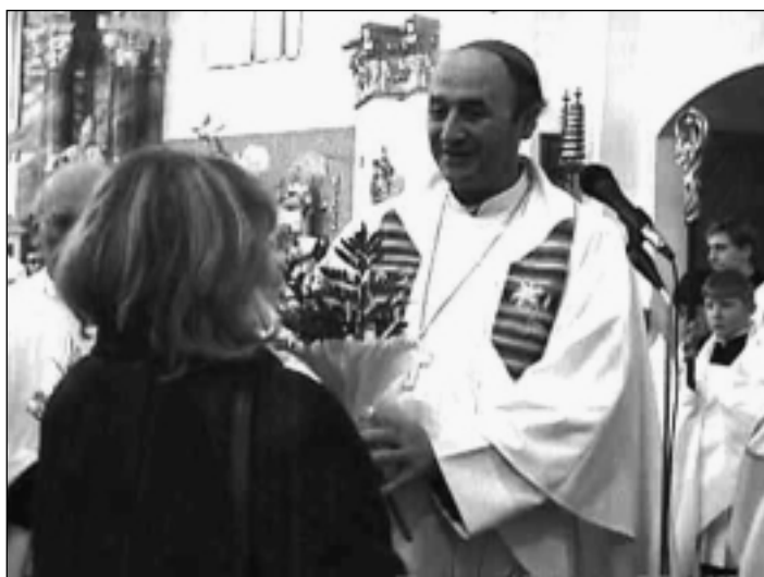
Přivítání otce arcibiskupa ve fryštickém kostele