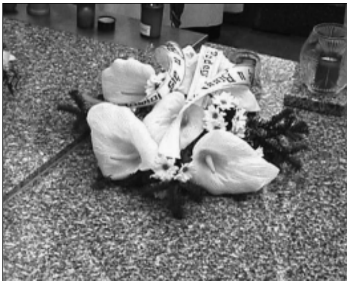
Kytice, kterou na hrob položila delegace příbuzných a přátel z rodiště P. Stuchlého, Boleslavi

20. 1. 2001 - uzavření diecézního procesu blahořečení.