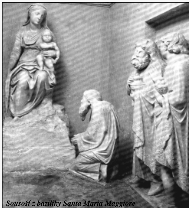
Sousoší z baziliky Santa Maria Maggiore

Ve snu dostali pokyn, aby se k Herodovi už nevraceli, proto se vrátili jinou cestou do své země.