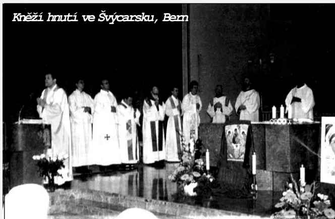
Kněžské hnutí ve Švýcarsku, Bern

Pohledně nyní na Ježíše na kříži. Tento pohled nás přivádí k vědmí, jak daleko zašla jeho láska k nám lidem. Ježíš se vydává za nás lidi v úplné chudobě. Nejdříve přišel na svět nahý v jeslích ve stáji a pak zcela nahý a nahý zemřel na kříži. A to nejdražší, tento zcela zchudlý Bůh, se nám stále znovu a znovu daruje v Eucharistii, a to ve zcela skromných a chudých způsobech chleba. Je to pokora a chudoba živého Boha, který nás stále znovu navštěvuje v každé eucharistické slavnosti. Tak daleko zašel náš Bůh. Sv. Augustin říká: »Velkou Boží touhou je člověk.« Bůh se činí tak chudým a tak malým, aby mohl být s člověkem. Touží po lidech a žízni po nás. Žízni