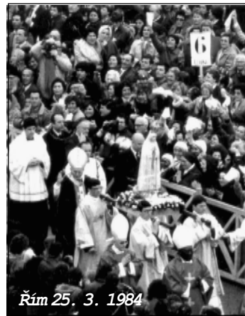
Řím 25. 3. 1984

svět. Proto již 8. prosince 1978 Svatý otec zvolal: »Římský biskup na počátku své služby na katedře svatého Petra v Římě touží zvláštním způsobem zasvětit Církev sobě svěřenou té, v níž se uskutečnilo vznešené a dokonale vítězství dobra nad zlem... Zasvěcuje jí římskou cír-