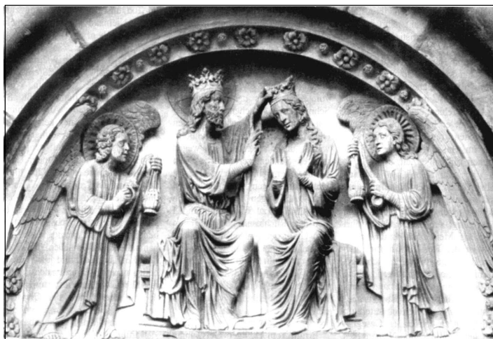
Koronování Panny Marie, reliéf ze štrasburské katedrály

a bez rozpadu těla, neboť tělo, které nosilo Krista s Jeho tělem a Jeho krví, tělo, jež bylo Archou Nové úmluvy, nemohlo spatřit ponušení.