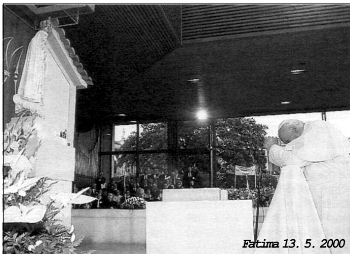
Fatima 13. 5. 2000

Cesta trvá již mnoho let. Až konečně nadejde den 13. května