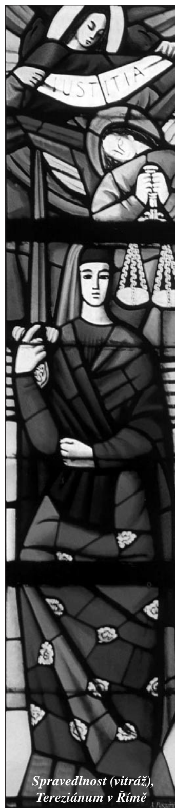
Spravedlnost (vitráž), Tereziánium v Římě

Budte opravdovými křesťany, důslednými ve vztahu k sobě samým.