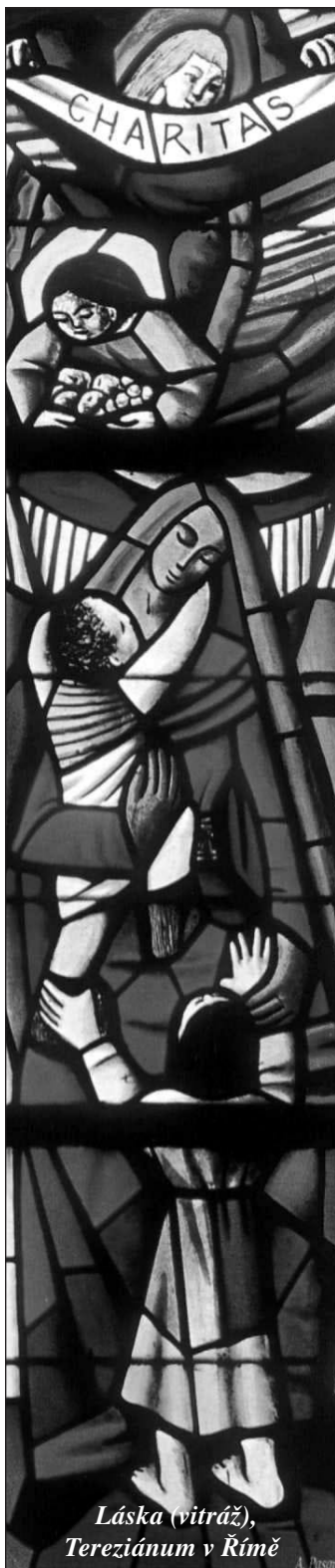
Láska (vitráž), Tereziánům v Římě

Tradiční pouť žáků a přátel Dona Boska na Svatém Hostýně se letos koná 24. května. Koncelebrovaná mše svatá za salesiánské poutníky bude slavena v 10.15 hod. a bude při ní zpívat smíšen sbor z Troubek u Přerova. Po mši svaté se koná společné setkání v bývalé tělocvičně Maticе svatohostýnské.