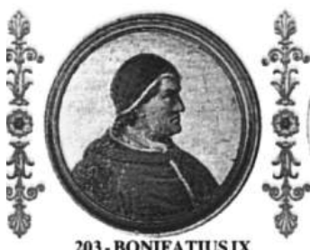
203 - BONIFATIUS IX

kteří probouzí zájem, jsou všechny snahy vysvětlit křesťanství zbytečné.