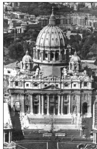
Bazilika sv. Petra

Velké východní schizma r. 1378 narušilo následnost jubilejních roků. Jednalo se totiž o konflikt spojený s legální volbou papeže. Také v tomto Jubilejním roce byl změněn časový rámec, protože byl předložen záměr vyhlášovat milostivá léta každých 33 let na památku Ježíšova pozemského života. Byla zde řada důvodů posunout ko-