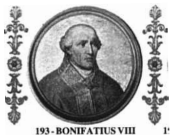
193 - BONIFATIUS VIII