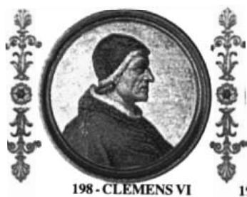
198 - CLEMENS VI