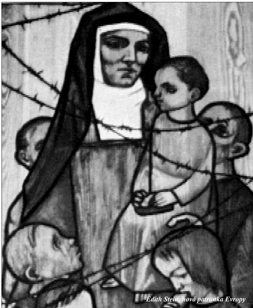
Edith Stein, nová patronka Evropy

INFORMACE O PŘEDPLATNÉM NA ROK 2000 V TOMTO ČÍSLE str. 16