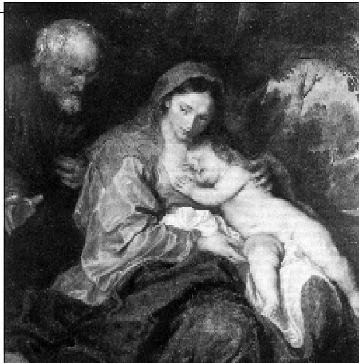
A. v. Dyck: Odpočinutí na cestě, 1622/1630 Mníchov

Kázání v katedrále v Kapském Městě bylo u konce. Ne-