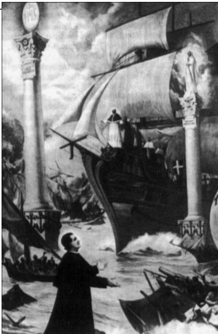
Vidění Dona Bosca

Ale ty, Itálie, země požehnaní, kdo tě to svedl? ..Neříkej, že tvoji nepřátelé, nýbrž tvoji přátelé. Neslyšíš, že tvoje děti si žádají chléb víry, a nenacházejí nikoho, kdo by jim ho lámal? Co udělám? Budu bít pastýře a stádo rozptýlím, aby ti, kteří sedí na stolci Mojžíšově, opět hledali dobré pastviny a stádo učenlivě naslouchalo