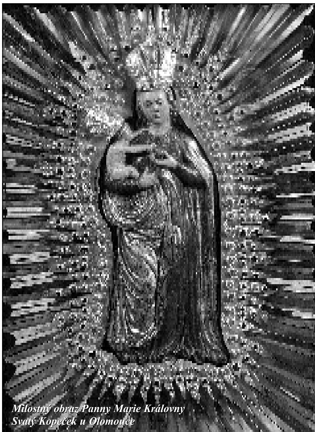
Milostný obraz Panny Marie Královny Svatý Kopeček u Olomouce