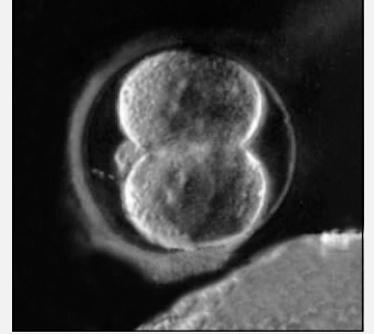
Zárodek v prvním dnu