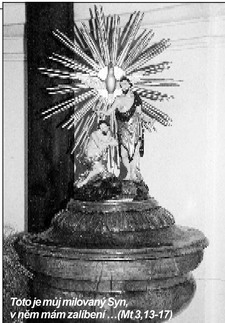
Toto je můj milovaný Syn, v něm mám zalíbení ... (Mt 3, 13-17)

Jordán totiž, ve kterém je Ježíš pokřtěn, není jakákoliv řeka. V průběhu dějin spásy se