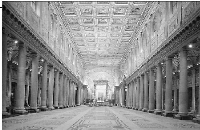
Velkolepý interiér baziliky Santa Maria Maggiore

O vánoční noci roku 1517 měl sv. Kajetán z Thieny, zakladatel teatinů, mimořádné vidění. Jeho životopisec o tom napsal: »Světce často navštěvoval kapli oratoria v bazilice Santa Maria Maggiore, aby zde potěšil své milující srdce. Tam se vrhl tváří až k zemi a před uctívanými jesličkami rozjímal o velké lásce našeho Boha, který se nechal zavinout do chudých plének jako dítě, protože on, nekonečná velikost, se chtěl ponížít. Když jednou klečel po slavnostních bohoslužbách o vánoční noci před božským Dítětem a propukl v pláč plný lítosti, prosil Matku Vykupitele, aby obměkčila jeho srdce ztvrdlé pýchou. Maria mu dovolila pohlédnout do nebe. Viděl, jak svatá Panna ozářená světlem tiskne Dítě na hrud' tak pevně, jako by se právě narodilo.« »Mé srdce bylo ztvrdlé (to mi můžete věřit),« píše sv. Kajetán sám v jednom dopise, »ale v jediném okamžiku je změnila. (...) Vzal jsem tedy křehké Dítě, tělo a šat věčného Slova, z její láskyplné náruče do své náruče.« Římský breviář poznamenává 7. srpna na svátek sv. Kajetána: Romae