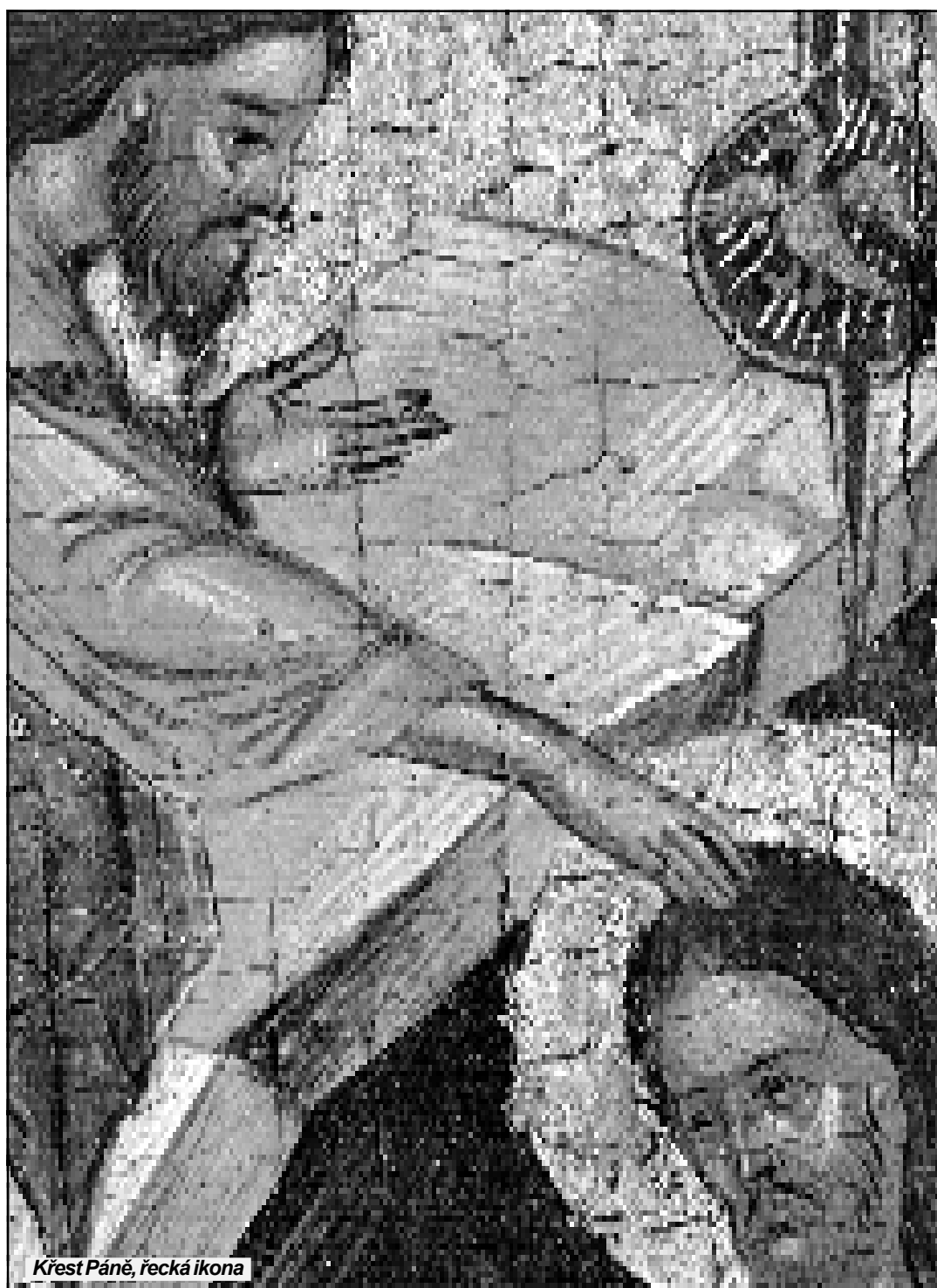
Křest Páně, řecká ikona