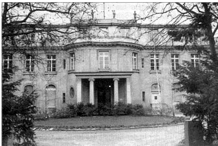
Víla ve Wannsee, kde se roku 1942 konala konference, na které padlo rozhodnutí o tzv. »konečném řešení«

Tehdy se v Třetí říši uskutečnila likvidace celých skupin