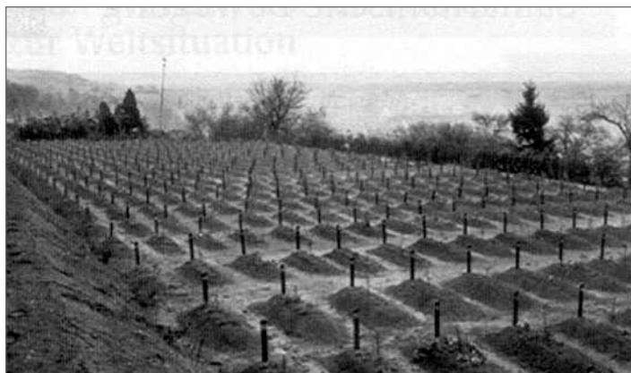
Hřbitov obětí »programu eutanázie« v Hadamaru dnes

lidí ve jménu ideologie »krve a rasy«. Dnes se uskutečňuje zabíjení nenarozených dětí ve jménu svobody a demokracie. Stát, který »legalizuje« svévolné zabíjení nevinných lidí, je na nejlepší cestě opakovat to, co se událo v Třetí říši v letech 1933-1945.