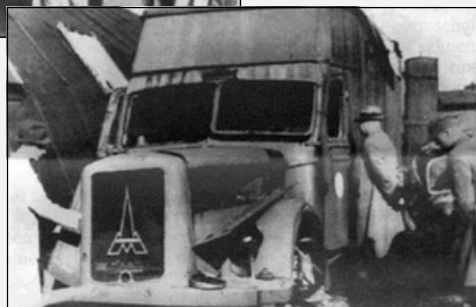
Nákladní auto, které bylo postaveno k usmrcování obětí výfukovými plyny