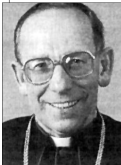
Salcburský arcibiskup Dr. Georg Eder

Kdo by mohl důstojně slavit tuto oběť, kdybys Ty, všemohoucí Bože, sám neučinil obětníka hodným. Vím to, Pane, a vím to velmi dobře a vyznávám to tvé slitovnosti, že nejsem hoden přistoupit k takovému tajemství pro množství svých hříchů a pro své nesčetné nedbalosti. Ale vím, z celého srdce věřím a svými ústy vyznávám, že Ty mě můžeš učinit toho hodným, protože ty jediný můžeš učinit čistého z toho, kdo byl počat z nečistého pokolení, z hříšných můžeš udělat spravedlivé a svaté. Pro tuto všemohoucnost tě prosím, můj Bože, abych tuto oběť slavil s bázní a strachem, s čistotou srdce, s hojnými slzami, s duchovním potěšením a nebeskou radostí. Ať moje mysl pocítí blaženou sladkost tvé přítomnosti a stráž svatých andělů všude kolem sebe.