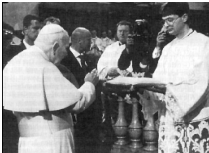
Svatý otec světlí korunku pro sochu Panny Marie v Salcburku