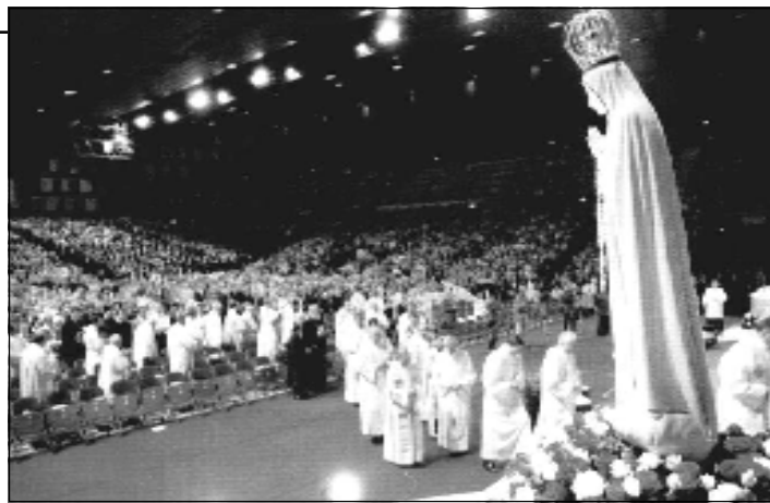
Hlavním celebrantem v sobotu byl kardinál Ch. Schönborn, v neděli kardinál König

Růžencová tajemství se tentokrát týkala veřejného života Pána Ježíše, který oznámil příchod Božího království: – který léčil nemocné a ujímal se