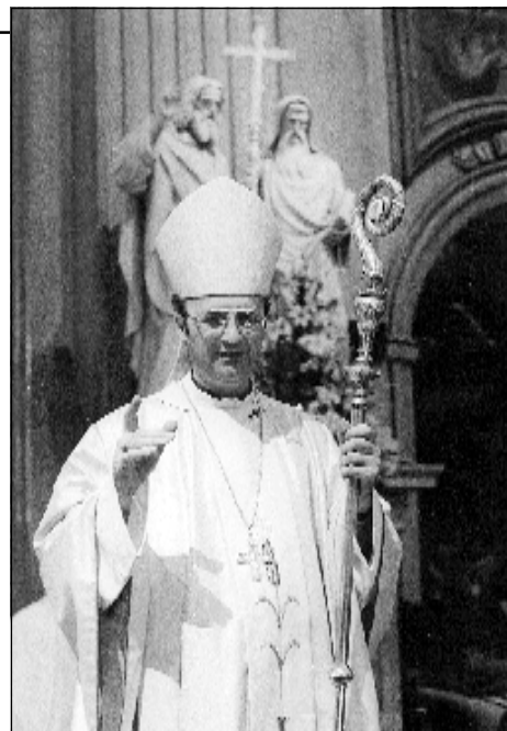
Mons. Jan Graubner, arcibiskup olomoucký

Proto Vás všechny velmi naléhavě prosím, abyste nezanedbali nic v předávání víry dětem a ve výuce náboženství. Nejdůležitější pro předávání víry dětem je přesvědčivý příklad Vašeho života z víry. Ale nutně je i vzdělávání ve víře. Přihlaste své děti do výuky náboženství ve škole. Každá škola má povinnost zajistit výuku náboženství pro děti, které se přihlásí. Zástupci některých škol říkají, že nemají peníze na zaplacení katechety, protože raději dávají přednost jiným nepovinným předmětům. Bohužel i někteří rodiče raději volí pro děti nepovinnou angličtinu nebo počítače než náboženství. Nemám nic proti těmto předmětům, ale jejich upřednostňování na úkor náboženství ukazuje na špatný stav naší společnosti, která už nemá smysl pro duchovní a mravní hodnoty. To vede k tomu, že všichni doplácíme na ne-