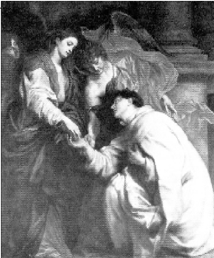
Epizoda zasnoubení s P. Marií od holandského malíře A. van Dycka