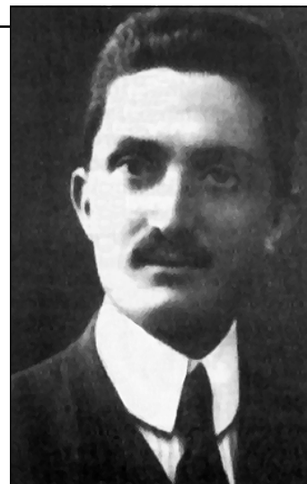
Sv. Riccardo Pampuri