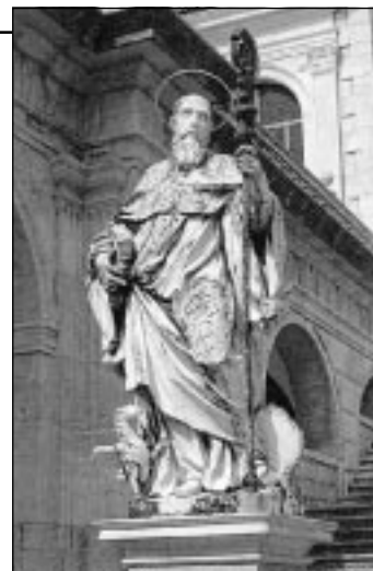
Benediktova socha na klášterním dvoře v Montecassinu

Tento mladý výhonek z nízké venkovské šlechty nebyl nikdy mužem převratných rozhodnutí. Byl vychováván v nursina severitas , v příslušné střízlivosti Nursie, malého ospalého sabinského městečka v provincii Valéria. Narodil se zde čtyři roky po sesazení posledního západofřímského císaře Romula