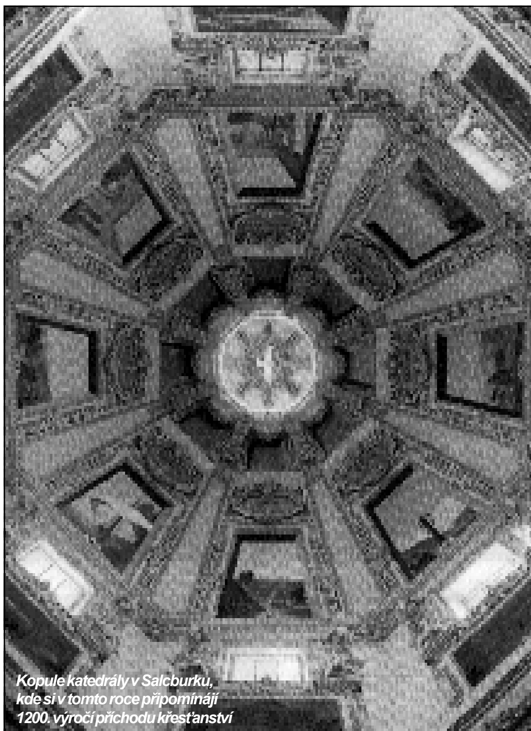
Kopule katedrály v Salcburku, kde si v tomto roce připomínají 1200. výročí příchodu křesťanství