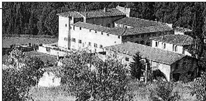
Budova Institutu Krista Krále a Velekněze

Přítom život v Griciliano není nijak snadný. Všechny práce si musejí seminaristé zajistit sami. Staré zdi šlechtické vily vypadají sice zvenčí pěkně, ale pro z pohodlné a rozmazané tu není nic. Strava je, jak se na seminář sluší, dobrá a zdravá. Jinak je každá minuta dne vyplněna modlitbou, studiem, domácí prací. Rozjímání, chvály, sexta, mše svatá, růženec, nešpory, kompletář, to všechno patří k programu stejně jako čištění zeleniny, umývání záchodů a zametání chodeb a dvora. Každodenní přednášky zabezpečují vnější i vlastní docenti, takže každý může získat církevně uznávané osvědčení. Společná spiritualita spojuje mnoho národností a umožňuje, že se tu rozvíjí velkodušnost srdce, které rádo přináší oběti, když jde o to, stát se knězem a sloužit