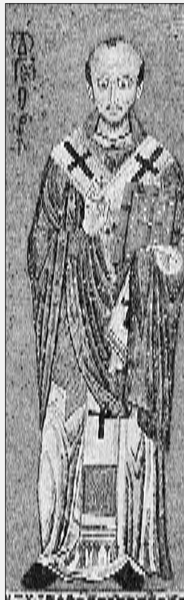
Sv. Jan Zlatoústý, mozaika v palatinské kapli v normánském paláci v Palermu na Sicílii