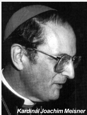
Kardinál Joachim Meisner

Kázání o fatimském dni, 13. ledna 1998 – bazilika sv. Jakuba v Praze