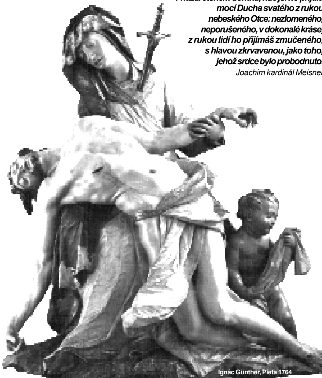
Ignác Günther, Pietà 1764