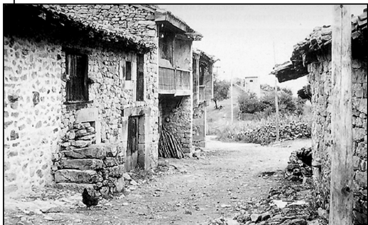
Domy byly stavěné z kamene a nebyla tam ani voda ani topení. Proud přicházel do vesnice jen na krátkou chvíli, aby mohlo svítit několik lamp na ulici. Uvnitř byl krb na vaření a několik úzkých matrací ze slámy...

Přitom jsem každý rok navštívil Garabandal. V roce 1964 jsem vyprávěl Conchitě o tom tajemném hlase, který jsem zaslechl v roce 1947, když jsem chodil do slepecké školy, a také jsem jí řekl o svém plánu – chtěl jsem totiž v New Yorku založit Dům bliženské lásky pro posti-