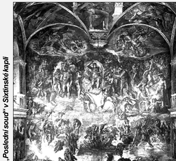
„Poslední soud“ v Sixtinské kapli