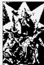
Na titulní straně: Přenesení Loretánského domku, mědirytina ze sbírky Zodiacus Festorum Marianorum, Augšpurk 1723

Podle Bolletino Vaticano Mezititulky a zdůraznění redakce Světla