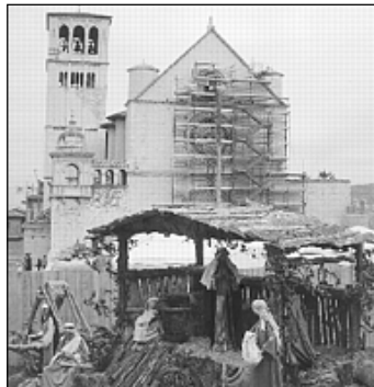
Asisi, Vánoce 1997

O této své návštěvě hovořil papež ve své krátké promluvě po modlitbě Anděl Páně v neděli 4. ledna. Vzpomněl však také