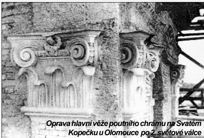
Oprava hlavní věže poutního chrámu na Svatém Kopečku u Olomouce po 2. světové válce