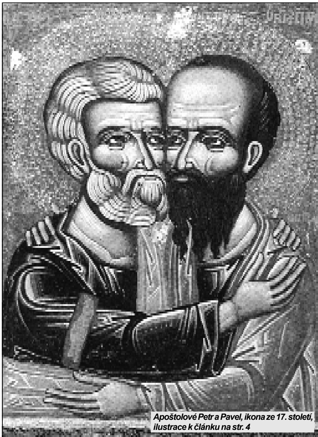
Apoštolové Petr a Pavel, ikona ze 17. století, ilustrace k článku na str. 4

Chodím do deváté třídy ZŠ v jednom okresním městě... – strana 10 –