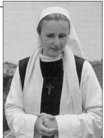
Medžugorje, 1. 5. 1997