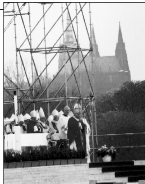
Letná 27. 4. 1997

Rodiny, které jsou hluboce poznamenané mravy, tradicemi, obyčejí a obřady vnitřně proniknutými vírou, jsou nejvhodnější půdou, kde vyrůstají duchovní povo-