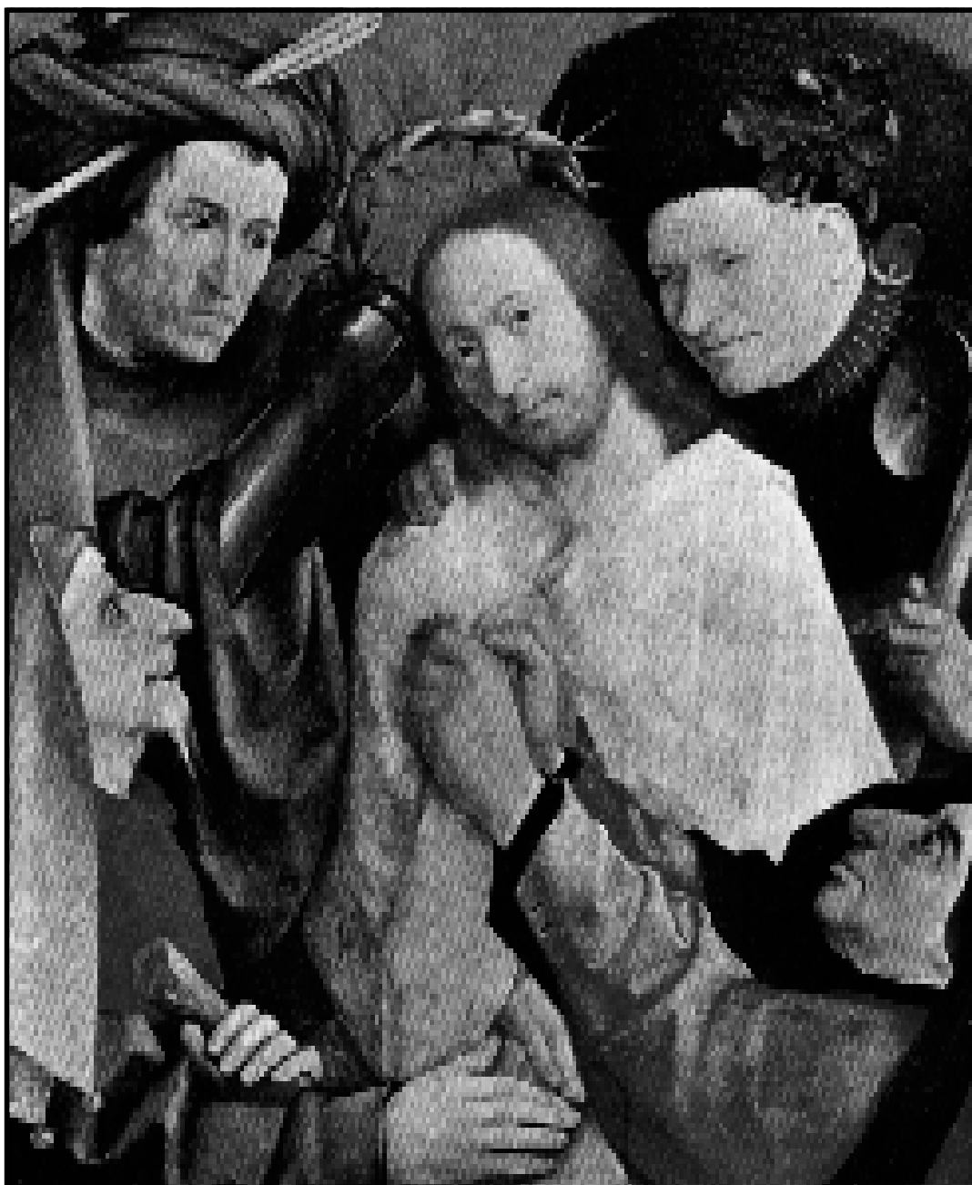
Hieronimus Bosch, Korunování trním, 1508

Ježíši, korunovaný trním, obtížený křížem, vydal ses tichý a trpělivý na cestu ke Golgotě, abys obětoval sám sebe... (z křížové cesty, kterou se modlil Svatý otec o Velkém pátku 1996 v římském Koloseu – přinášíme vám ji na str. 11).